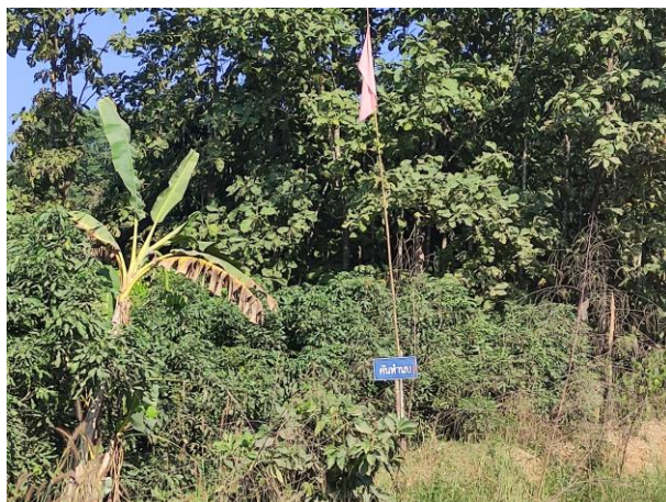
รูปที่ 2-24 แนวรณรงค์เขตพื้นที่การทำเหมือง (เขตประทานบัตร)