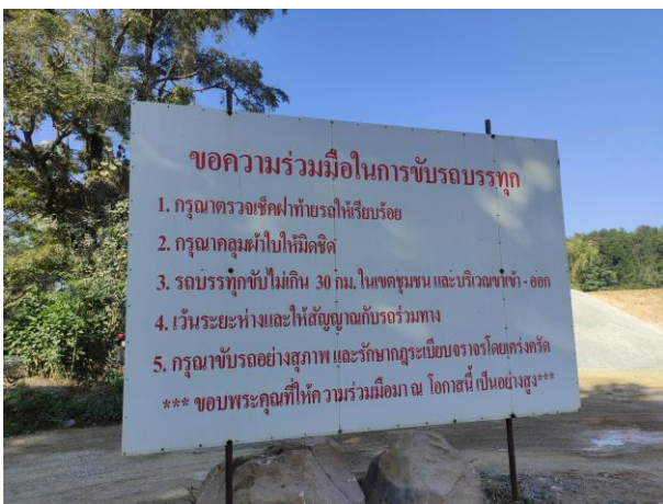
รูปที่ 2-5 ข้อกำหนดในการจราจรของโครงการ