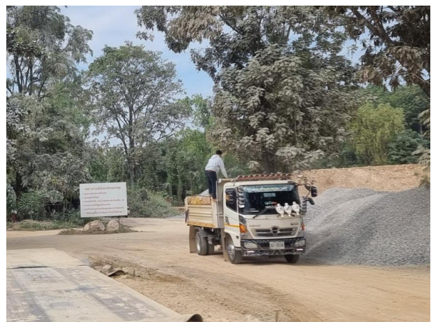
รูปที่ 2-5 (ต่อ) จุดปิดคลุมกระบะบรรทุกในโครงการ