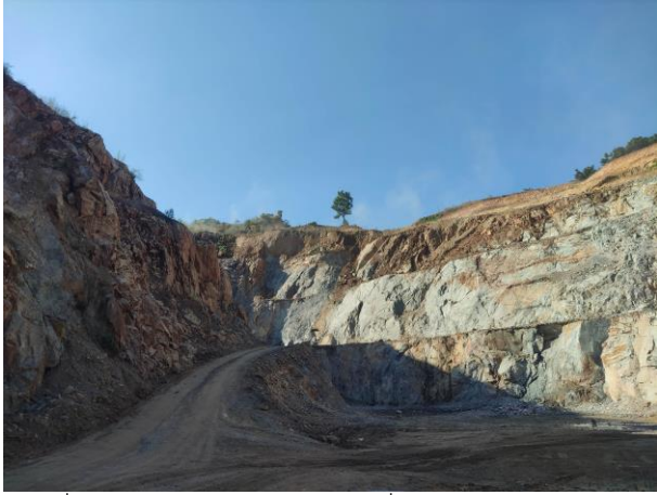
รูปที่ 2-1 หน้าเหมืองของโครงการที่มีการปรับแต่งให้เป็นไปตามที่มาตรการฯ กำหนด