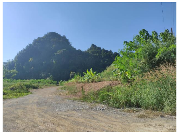
รูปที่ 2-13 (ต่อ)