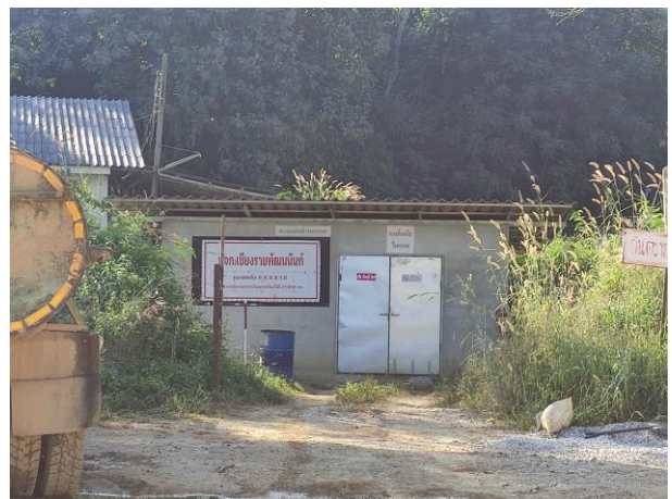
รูปที่ 2-2 (ต่อ)