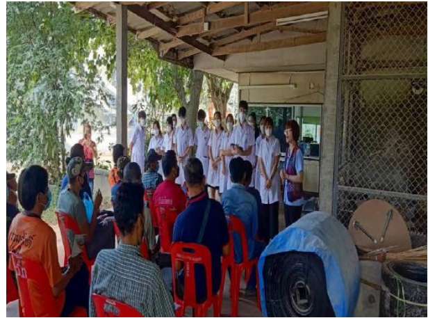
รูปที่ 2-25(ต่อ)