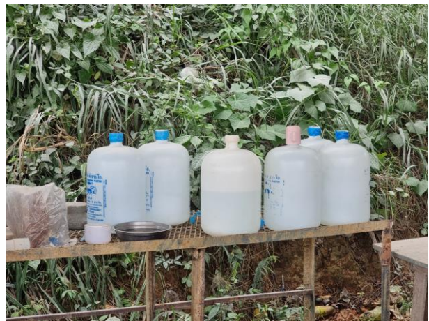
รูปที่ 2-27 น้ำดื่มสำหรับพนักงาน