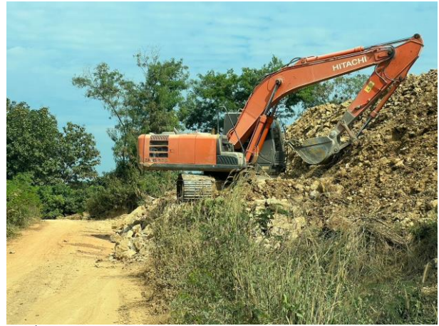
รูปที่ 2-11 การซ่อมแซมคันทำนบดินในช่วงหน้าแล้งและเตรียม ปลูกต้นไม้ในช่วงหน้าฝน