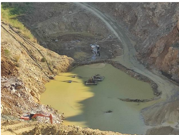
รูปที่ 2-18 บ่อรับน้ำบริเวณพื้นที่ต่ำสุดของบ่อเหมือง