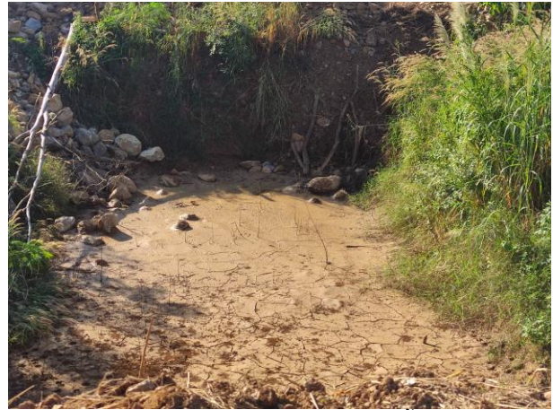
รูปที่ 2-9 ตัวอย่างบ่อดักตะกอนและคูระบายน้ำที่มีการดูแลให้ มีประสิทธิภาพเป็นอย่างดี