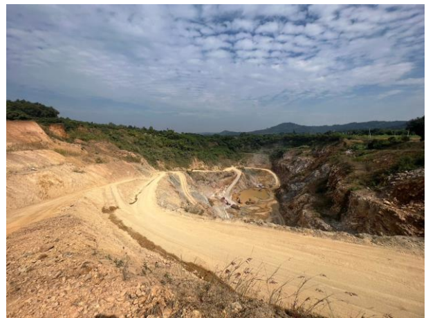
รูปที่ 2-17 ขุมเหมืองเก่าที่ดัดแปลงเป็นพื้นที่เก็บกองเปลือกดิน