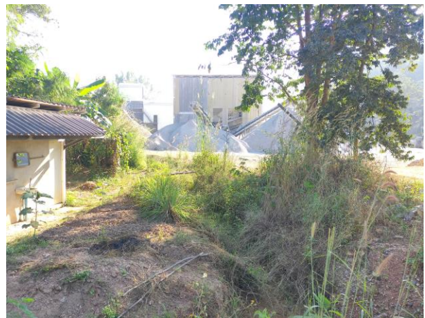
รูปที่ 2-7 (ต่อ) คูระบายน้ำโดยรอบโรงโมหิน