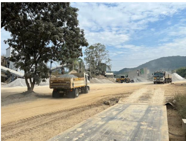
รูปที่ 2-6 ตาข่ายเพื่อป้องกันการบรรทุกน้ำหนักเกิน