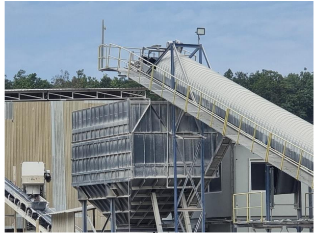
รูปที่ 2-7 (ต่อ) การสเปรย์น้ำที่ปลายสายพานลำเลียงหิน