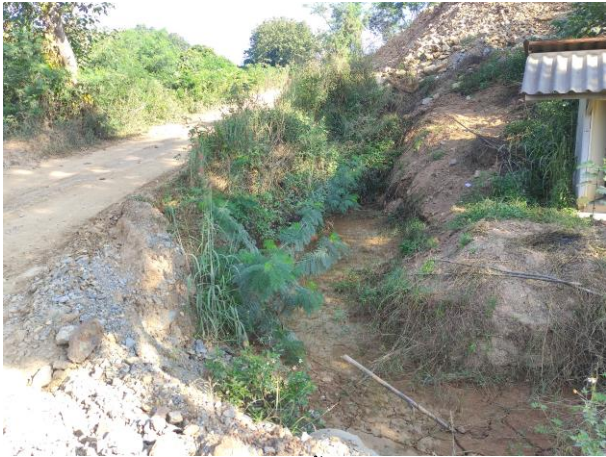
รูปที่ 2-8. (ต่อ) คูระบายน้ำรอบจุดกองเปลือกดิน