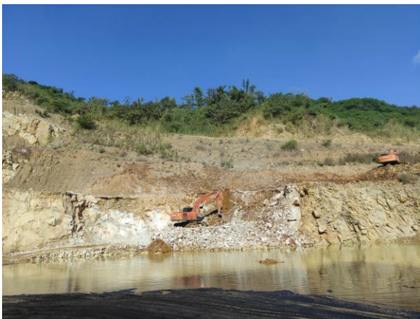
รูปที่ 2-1 (ต่อ)