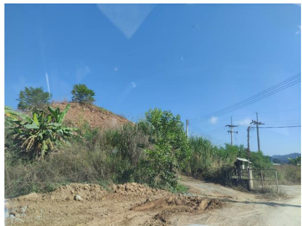
รูปที่ 2-13 ตัวอย่างต้นไม้ที่ทำการปลูกในกิจกรรมการฟื้นฟู พื้นที่การทำเหมือง