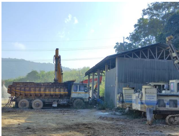
รูปที่ 2-26 โรงซ่อมบำรุง