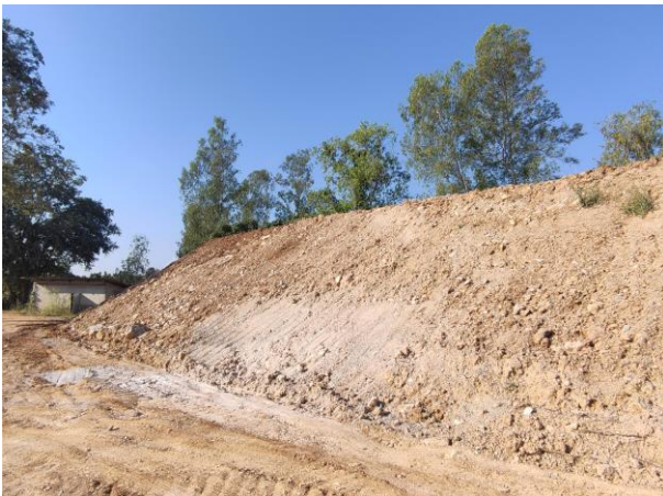
รูปที่ 2-8. จุดกองเปลือกดินตามแผนผังโครงการ