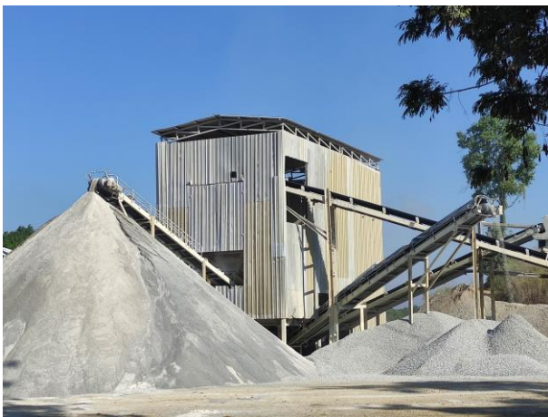
รูปที่ 2-7 (ต่อ) การปิดคลุมสายพานลำเลียง