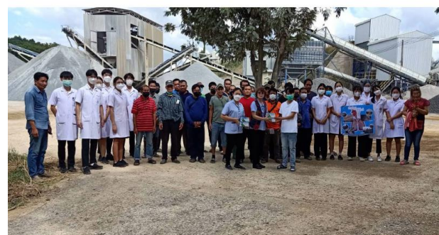
รูปที่ 2-25 กิจกรรมการตรวจสอบสุขภาพพนักงานประจำปี 2566