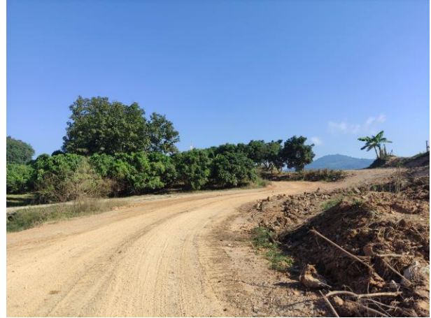
รูปที่ 2-4 สภาพถนนที่มีการดูแลจากทางโครงการ