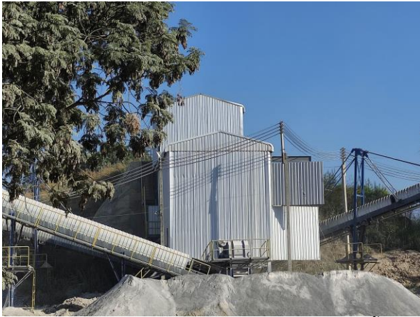
รูปที่ 2-7 โรงโมหินที่ทำตามประกาศกรมอุตสาหกรรมพื้นฐานและการเหมืองแร่ของโครงการ