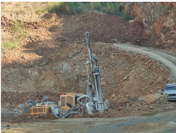
รูปที่ 2-16 เครื่องเจาะระเบิดของโครงการ