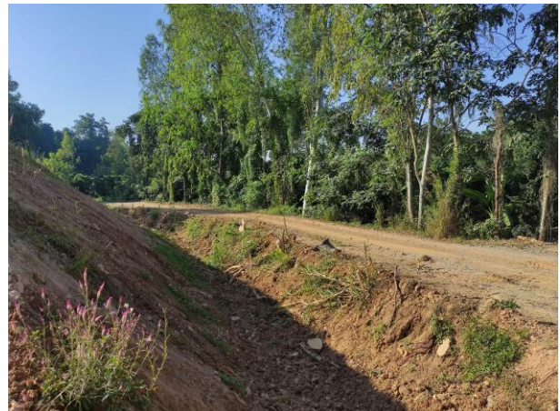
รูปที่ 2-8. (ต่อ) คั่นทำนบดินโดยรอบจุดกองเปลือกดิน