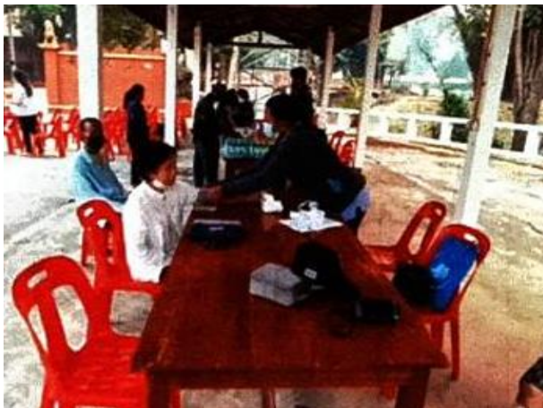
รูปที่ 2-28 กิจกรรมการตรวจสุขภาพประชาชน ปี 2566