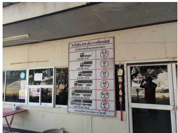
รูปที่ 2-6 (ต่อ)