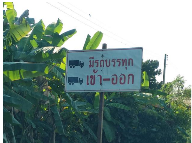
รูปที่ 2-19 ตัวอย่างป้ายระวางรถบรรทุกทุกเข้า-ออก ของโครงการ