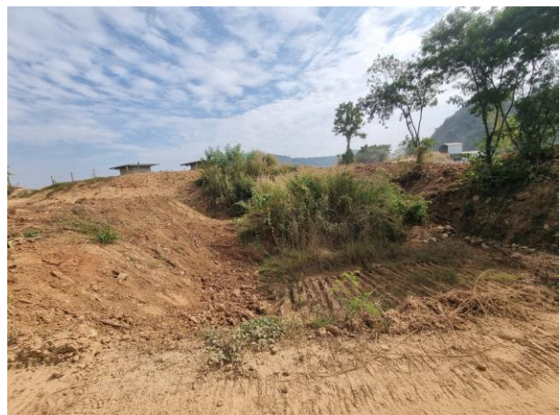
รูปที่ 2-10(ต่อ)