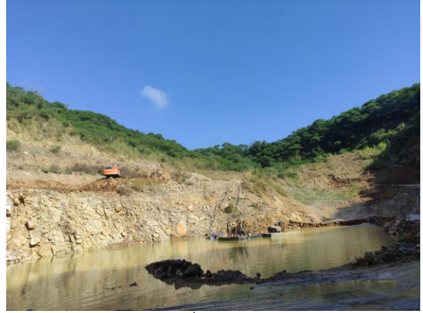
รูปที่ 2-1 (ต่อ)