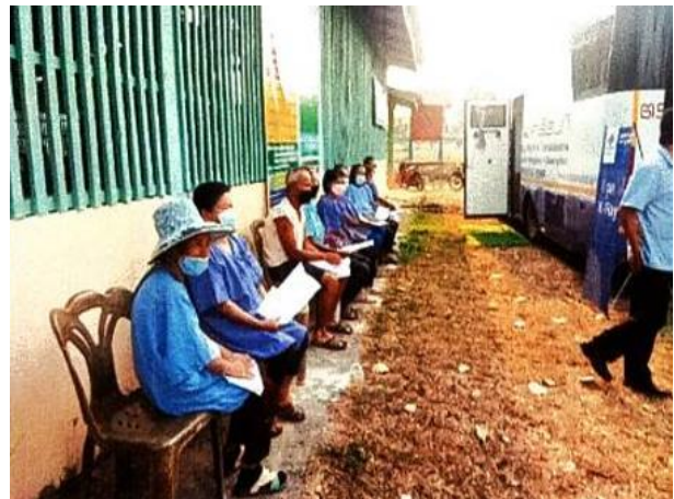
รูปที่ 2-28(ต่อ)