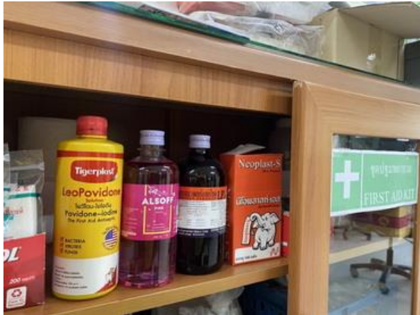
รูปที่ 2-20 ตู้ยาสำหรับปฐมพยาบาล (ภาพกิจกรรมล่าสุด)