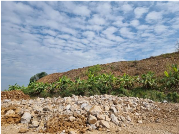
รูปที่ 2-10 (ต่อ) การปลูกพืชคลุมดินบริเวณผนังคันทำนบดิน และปลูกต้นไม้บนคันทำนบดิน