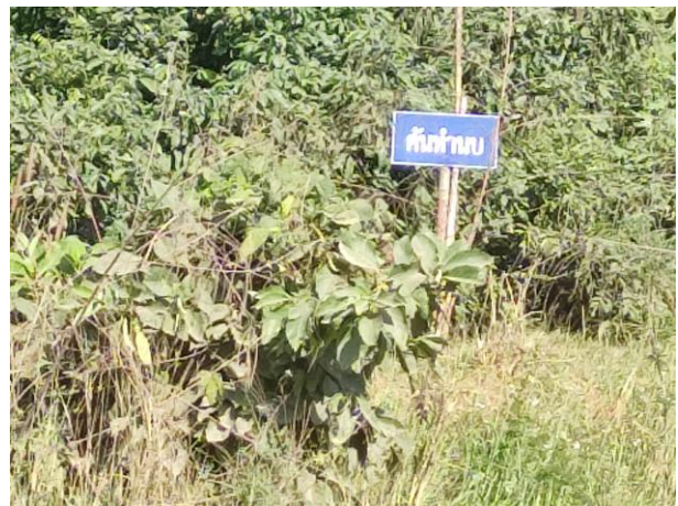
รูปที่ 2-10 คันทำนบดินของโครงการ