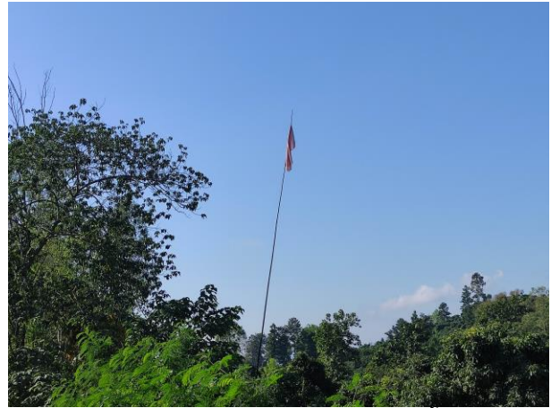
รูปที่ 2-15 ตัวอย่างแนวธงที่ใช้ในการแสดงเขตพื้นที่ต่างๆในโครงการ