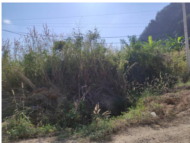
รูปที่ 2-13 (ต่อ)