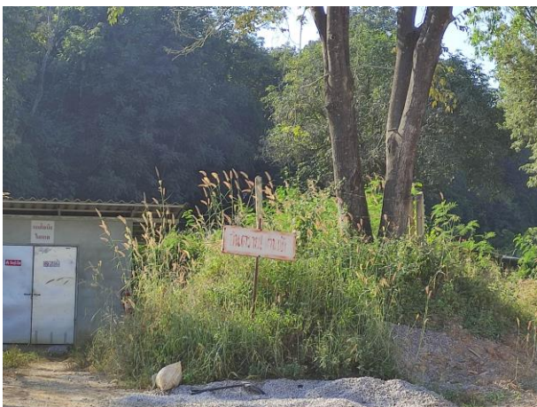
รูปที่ 2-2 ป้ายเตือนเขตการใช้วัตถุระเบิด