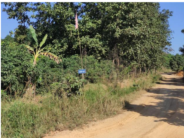
รูปที่ 2-10(ต่อ)