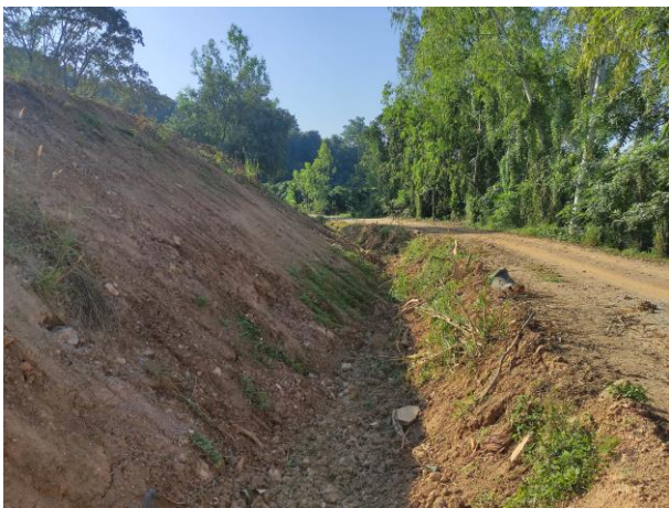
รูปที่ 2-9 (ต่อ) คูระบายน้ำโดยรอบ