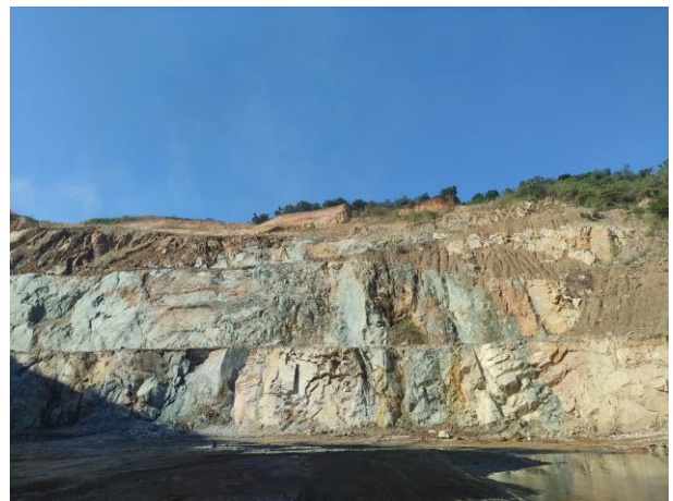
รูปที่ 2-1 (ต่อ)