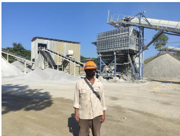
รูปที่ 2-12 อุปกรณ์ป้องกันอันตรายส่วนบุคคล