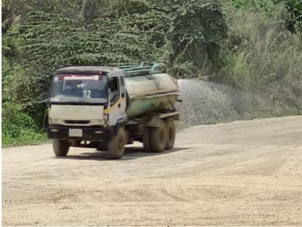
รูปที่ 2-3 การฉีดพรมพื้นที่และเส้นทาง