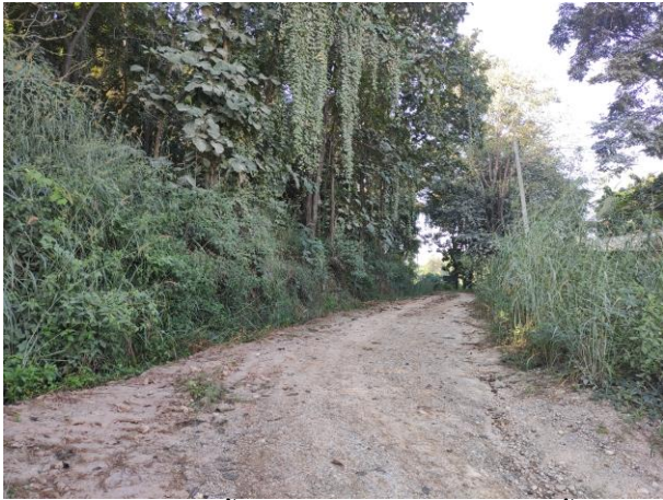
รูปที่ 2-14 แนวเวนพื้นที่การทำเหมืองเชิงเขาของวัดถ้ำผาจุย