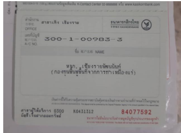
รูปที่ 2-21 บัญชีกองทุนพื้นที่พื้นที่เหมืองแร่ของโครงการ