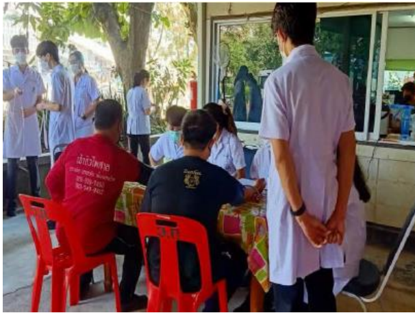
รูปที่ 2-25(ต่อ)